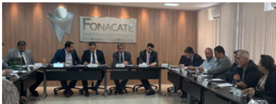
Sindicalistas fazem sugestões para o ato do dia 18 de março no Fonacate

O Anffa Sindical e demais representantes de entidades sindicais se reuniram, nos últimos dias, para ajustar detalhes relacionados ao Dia Nacional em Defesa do Servidor Público, marcado para 18 de março. Durante reuniões no Fonacate (Fórum Nacional Permanente de Carreiras Típicas de Estado) e no Fonasefe (Fórum das Entidades Nacionais dos Servidores Públicos Federais), ocorridas em Brasília, o foco foi a estrutura organizacional para o evento e o impacto que ele deve gerar junto ao Governo.