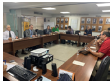
Lideranças detalham ações de mobilização em reunião no Fonasefe

Na capital federal, três carros de som estão divulgando o ato, na Esplanada dos Ministérios, além da veiculação de chamadas nas rádios BandNews e CBN. Espera-se a participação de aproximadamente cinco mil pessoas, que se concentrarão às 9h, em frente ao Teatro Nacional e seguirão, pela contramão, para o Ministério da Economia.