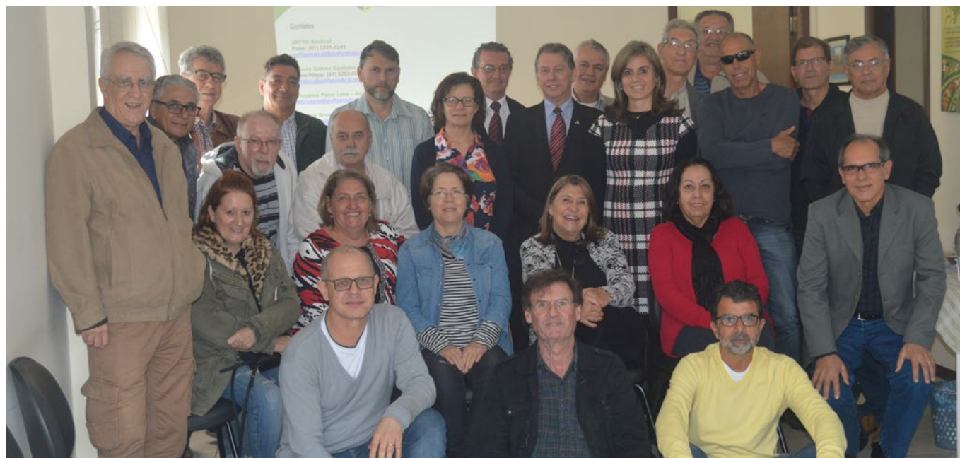
Grupo que participou do curso, em Santa Catarina